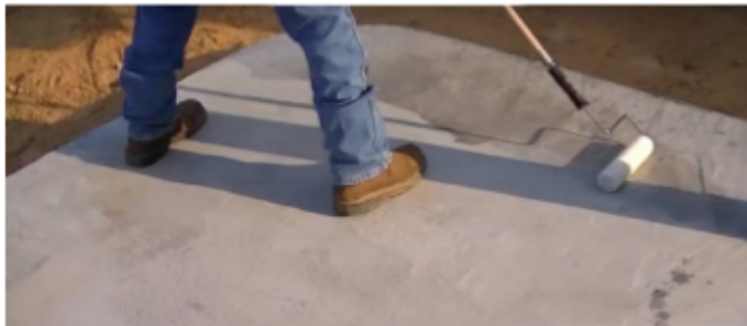
Układanie IMPRIDUR na podłoża z izolacją przeciwwilgociową.

1. Podłoże musi zostać oczyszczone ze wszelkich zanieczyszczeń, pyłu, pozostałości betonu, oleju, smarów i luźnych cząstek. Nakładanie powłok systemu Teais Infantiles możliwe jest bezpośrednio na podłoża asfaltowe, betonowe, ceramiczne lub wykonane z zapraw. Przygotowanie powierzchni jest uzależnione od jej porowatości oraz izolacji przeciwwilgociowej. Na podłoża posiadające izolację przeciwwilgociową należy wykonać gruntowanie warstwą IMPRIDUR , a podłoża bez izolacji należy zagruntować samopoziomującą, epoksydową warstwą DUREPOX AUTONIVELANTE o grubości 2 mm.