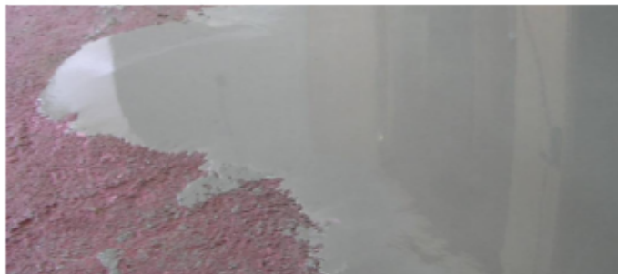
Układanie samopoziomującej warstwy DUREPOX AUTONIVELANTE na podłoża bez izolacji przeciwwilgociowej.