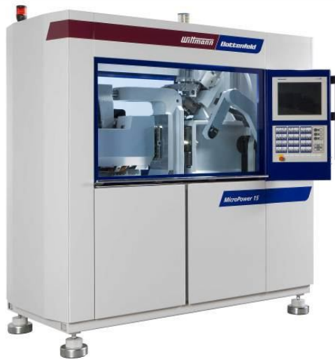
Fig. 1: Mikro części z płynnego silikonu produkowane są na wtryskarce MicroPower 15/10