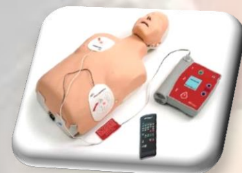
Brayden – 1 szt.