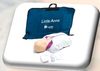
Little Ann – 1 szt.