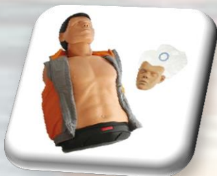
Ambu Man – 2 szt.